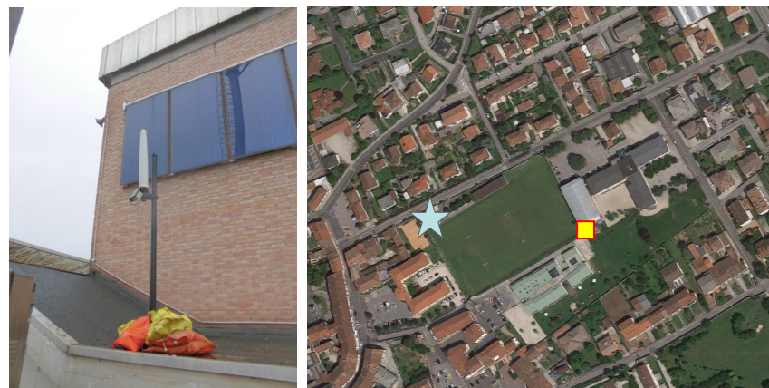
Name: 05prn_04 2017 Date: 01/04/2017 Time: 00:01

I livelli di protezione appena descritti devono intendersi come i valori medi su un'area equivalente alla sezione verticale del corpo umano e su qualsiasi intervallo temporale di sei minuti.