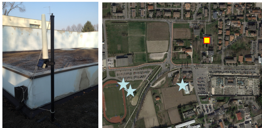
Name: 05pmm_02.2016 Date: 17/02/2016 Time: 13:00