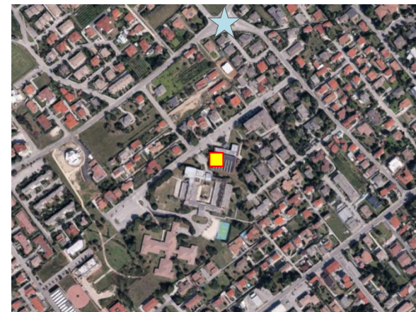
Name: 08-2019_cd3 Date: 01/08/2019 Time: 00:00