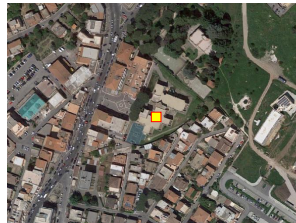
Name: 13 Date: 01/09/2018 Time: 00:00