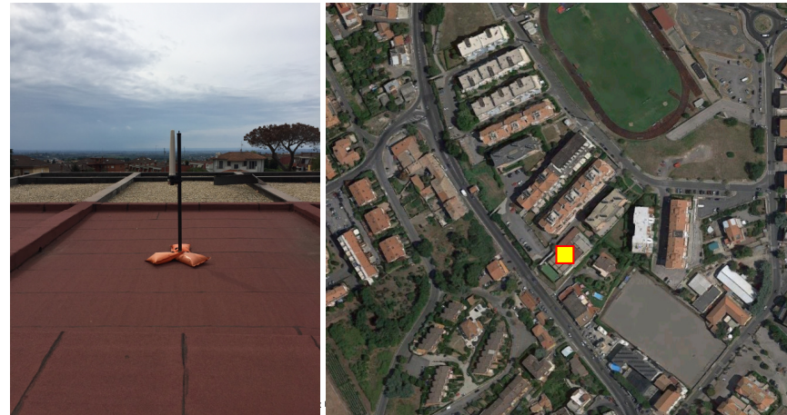
Limiti di esposizione per la popolazione ai campi elettromagnetici